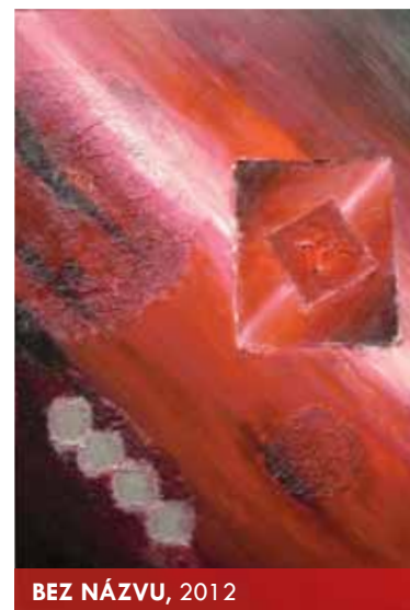
BEZ NÁZVU, 2012

Už několik let mám webové stránky www.novotny-obrazy.wbs.cz s galerií svých obrazů a většinu z nich jsem prodal. Občas svým přátelům maluji „na zakázku“ a velikost obrazu a barevné ladění podří-