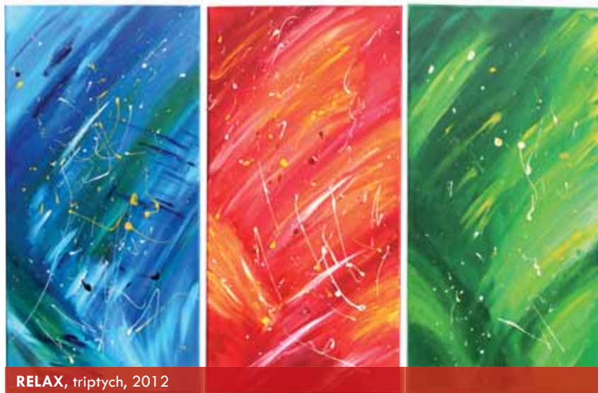
RELAX, triptych, 2012

ximálně věnovala a učila mě kreslit první zvířátka, přírodu a lidské postavy. V šesti letech mě přihlásila do Základní umělecké školy Jana Štursy v Novém Městě na Moravě, kde dodnes bydlíme. Tam jsem dostal základy většiny výtvarných technik od tuše, křídly, akvarelu až ke keramice. Záhy jsem začal objevovat krásu temperových barev a křídly, a těmito materiály maluji rád dodnes.